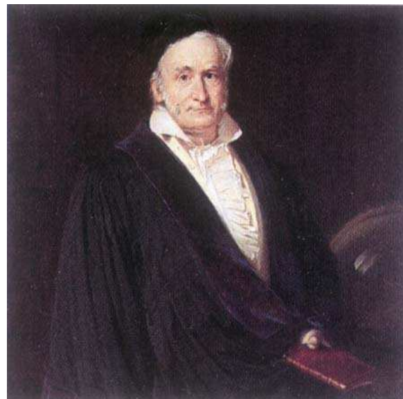
Carl Friedrich Gauss 1777 - 1855

Gauss conformó el tratamiento de observaciones como una herramienta práctica